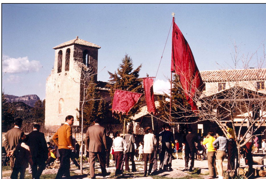
Fotografia dels anys setanta.

L'any 1970, emperò, la Corporació Municipal va sol·licitar al bisbe Bascunyana el canvi de data segons sembla per raons de feligresia i aquest així ho va autoritzar amb la data de 15 de juny del mateix any: la nova diada escollida va ser el dilluns de Pasqua- cosa que s'ha seguit mantenint fins al dia d'avui.