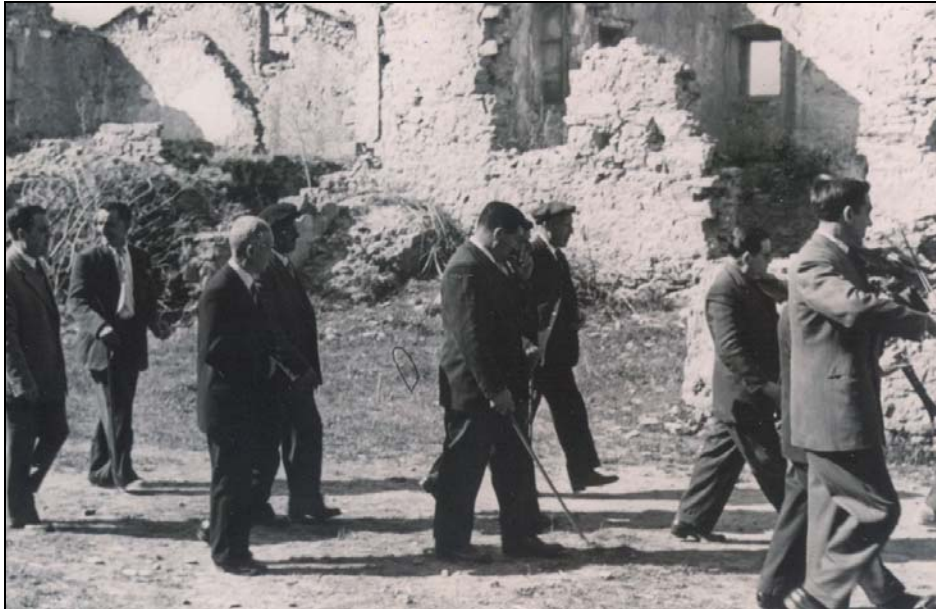
Pas de la processó l'any 1961.

Pel vot del poble, el dia d'avui celebrava festa el llogaret de Montclar de Berga. Com que està format per poques cases i encara escampades, avui era l'únic dia de l'any que s'aplegaven els regidors i que es veien tots reunits. Segons dir del poble, pagaven del comú la festa religiosa o "un cantar". Al migdia feien el "fart" o la "fartanera", consistent en un àpat col·lectiu a l'hostal, pagat així mateix pel fons comunal.